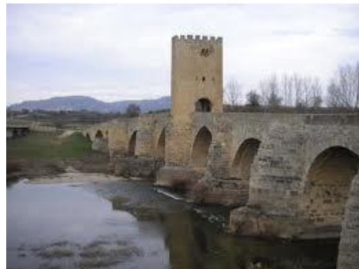
El puente medieval de Frías