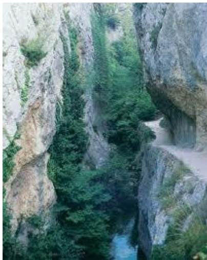
El desfiladero del Purón en Burgos