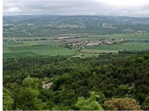
San Martín y la ermita entre pinos y hayas