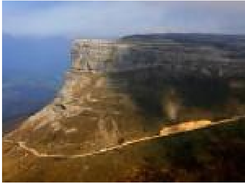
El camino que bordea el Aro

El Puente Medieval de Frías nos recibe como símbolo del viaje compartido. Cada año, esta aventura deja huella. No solo en el cuerpo... también en el alma.